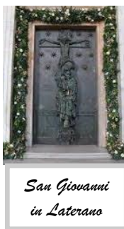
San Giovanni in Laterano

I pellegrini entrano nelle basiliche chiedendo la grazia della conversione