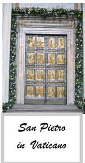
San Pietro in Vaticano