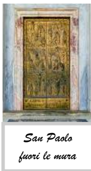
San Paolo fuori le mura