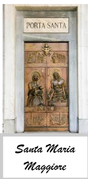
Santa Maria Maggiore

Durante il Giubileo, l'ingresso a queste basiliche avviene attraverso la porta santa che si trova in ognuna di esse.